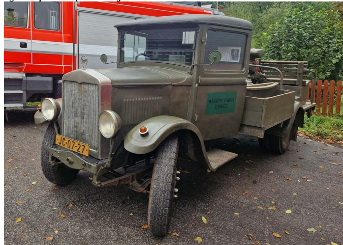
Praga AN "Andula"

tých letech, ale to už jsme měli stříkačky motorové a auto Praga AN, takže už jsme byli hasiči, kteří byli k něčemu platní. V sedmdesátých letech byla vybudovaná ještě nádrž za Medvědí hradem. Hasiči tady fungovali prakticky nepřetržitě 120 let. Byly mezi nimi ale i roky krizové, to si nemyslete. V Kyjích bylo v některých letech celkem 32 obyvatel, včetně žen a dětí, a stejně jsme drželi družstvo a stejně jsme se zúčastnili soutěží, což nyní zpětně považují za zázrak.