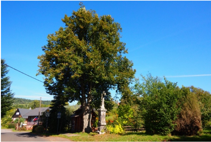
Loni proběhl odborný ořez lípy a úprava vazby koruny.